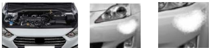
POSIBLE DAÑO INTERNO