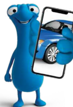
DETALLE DEL DAÑO

“ENVÍAR FOTOGRAFÍAS CLARAS, ESTO GARANTIZA UNA CORRECTA EVALUACIÓN DE LOS DAÑOS”