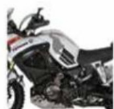
DETALLE 1 DEL DAÑO