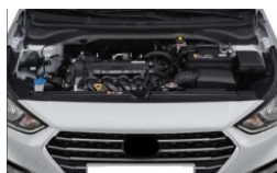
POSIBLE DAÑO INTERNO