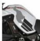
DETALLE 2 DEL DAÑO