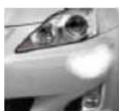
DETALLE 1 DEL DAÑO