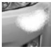
DETALLE 2 DEL DAÑO