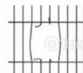
DETALLE DEL DAÑO