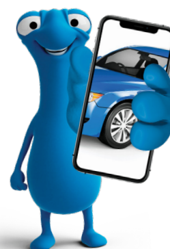
DETALLE DEL DAÑO

“ENVÍAR FOTOGRAFÍAS CLARAS, ESTO GARANTIZA UNA CORRECTA EVALUACIÓN DE LOS DAÑOS”